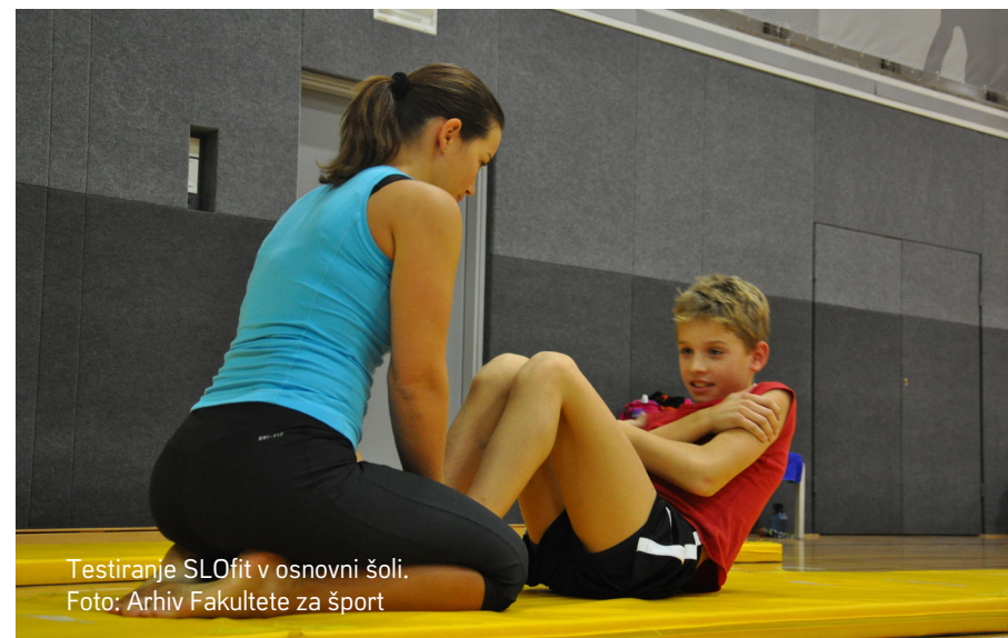
Testiranje SLOfit v osnovni šoli.

Tudi vsi posamezniki lahko do podatkov svojih testiranj dostopajo preko aplikacije Moj SLOfit. Poleg športne aktivnosti jih aplikacija med drugim spodbuja tudi k zmanjševanju zdravju škodljivih navad in stanj, kot sta kajenje in debelost. Svoje podatke SLOfit lahko delijo s strokovnjaki za zdravje in telesno vadbo, kar jim omogoča, da z vključitvijo v strukturirano vadbo izboljšajo kakovost svojega življenja.