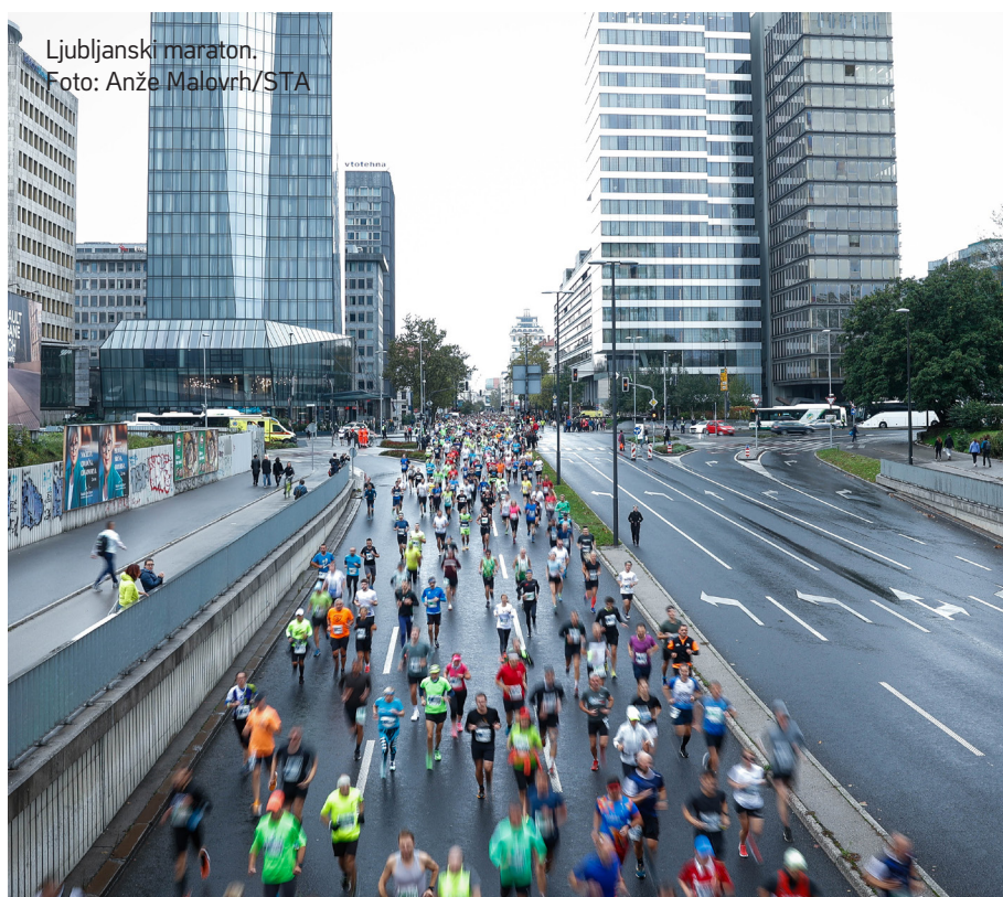
Ljubljanski maraton.

Edinstven tekaški dogodek je tudi tek trojk v sklopu prireditve na Poti ob žici okupirane Ljubljane, ko morajo trije tekači – moški, ženske ali mešana ekipa - teči skupaj, za njihov rezultat šteje čas tistega, ki zadnji v ekipi preteče ciljno črto.