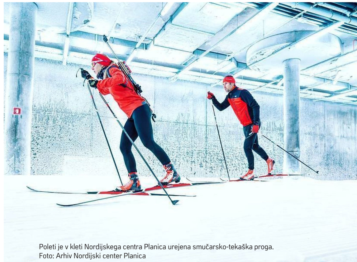
Poleti je v kleti Nordijskega centra Planica urejena smučarsko-tekaška proga.