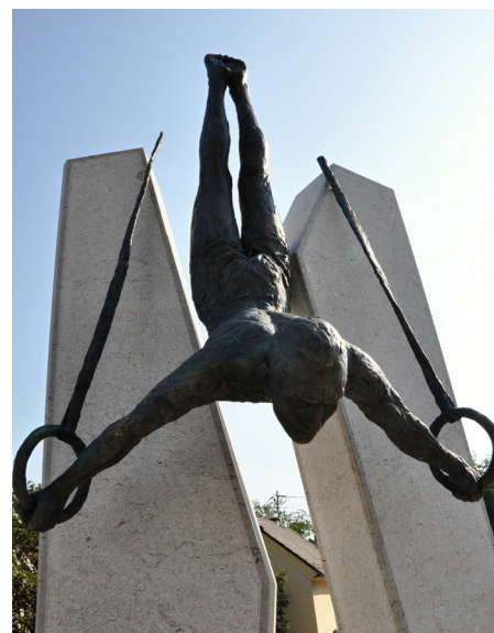
Leon Štukelj – legenda slovenske olimpijke.

Slovenski šport so zaznamovali številni vrhunski športniki, ki so premikali meje v svojih panogah. Njihovi uspehi so zapisani v analih športne zgodovine, v Sloveniji pa njihovo brezčasnost zgotavlja vpis v Hram športnih junakov . Izbor pripada Društvu športnih novinarjev Slovenije, ki sicer vsako leto izbira tudi športnika, športnico, ekipo in mlade upe leta. Namen Hrama je tudi ohraniti rekvizite in druge športne predmete, s katerimi so bili povezani slovenski športniki, ter različne športne zgodovinske dogodke.