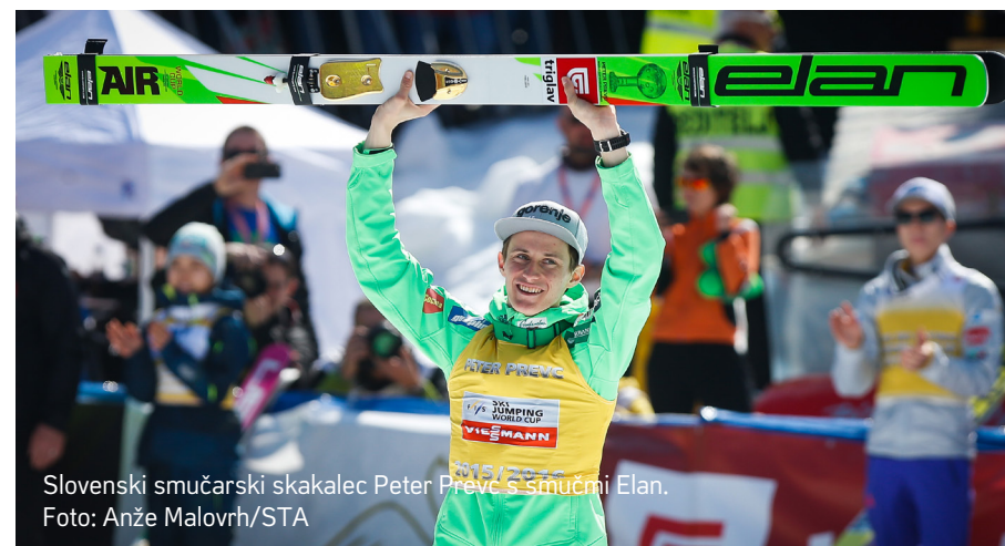
Slovenski smučarski skakalec Peter Prevc s smučmi Elan.

Eno najbolj prepoznavnih slovenskih podjetij v svetu pa je nedvomno Elan , ki že skoraj 80 let izdeluje najboljše smuči na svetu. Samo v zadnjih dveh desetletjih so s strani neodvisnih institucij prejeli več kot 70 nagrad za inovativnost, kakovost in oblikovanje. Med njihovimi največjimi inovacijami so carving smuči, in revolucionarne zložljive turne smuči IbeX Tactix. Proizvodnjo Elanovih skakalnih smuči pa je prevzelo drugo slovensko podjetje in zdaj so znane kot smuči Slatnar.