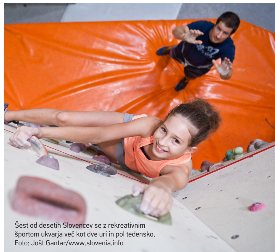
Šest od desetih Slovencev se z rekreativnim športom ukvarja več kot dve uri in pol tedensko.

Ker se zavedamo, da za ukvarjanje s športom nimamo vsi enakih možnosti, v Sloveniji namenjamo veliko pozornost pri vključevanju v šport tudi gibalno oviranim. V ta namen izvajamo projekt Aktivni, zdravi in zadovoljni, ki je namenjen spodbujanju invalidov vseh starostnih skupin k športnemu udejstvovanju in usposabljanju strokovnih delavcev.