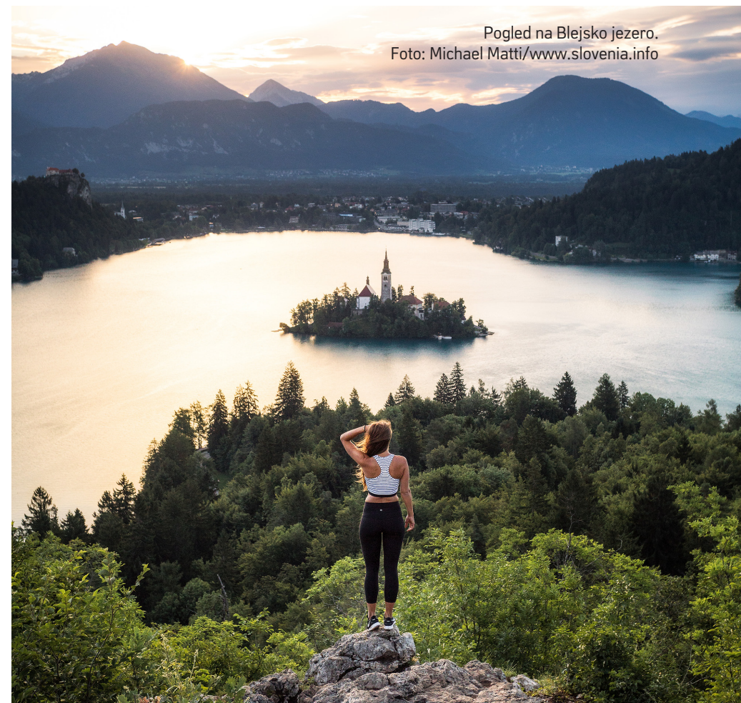
Pogled na Blejsko jezero.

Zanimiva je tudi vključitev slovenskih vrhunskih športnikov, ki organizirajo svoje kampe za nadobudne mlade športnike, na primer Anže Kopitar in Goran Dragič vsako leto pripravita kampe, ki jih obišejo otroci z vseh koncev sveta.