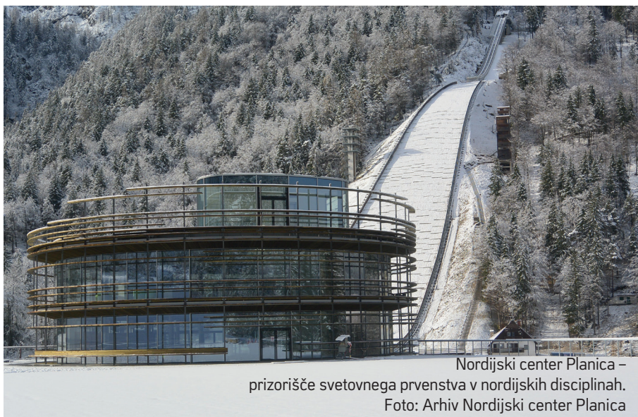
Nordijski center Planica – prizorišče svetovnega prvenstva v nordijskih disciplinah.