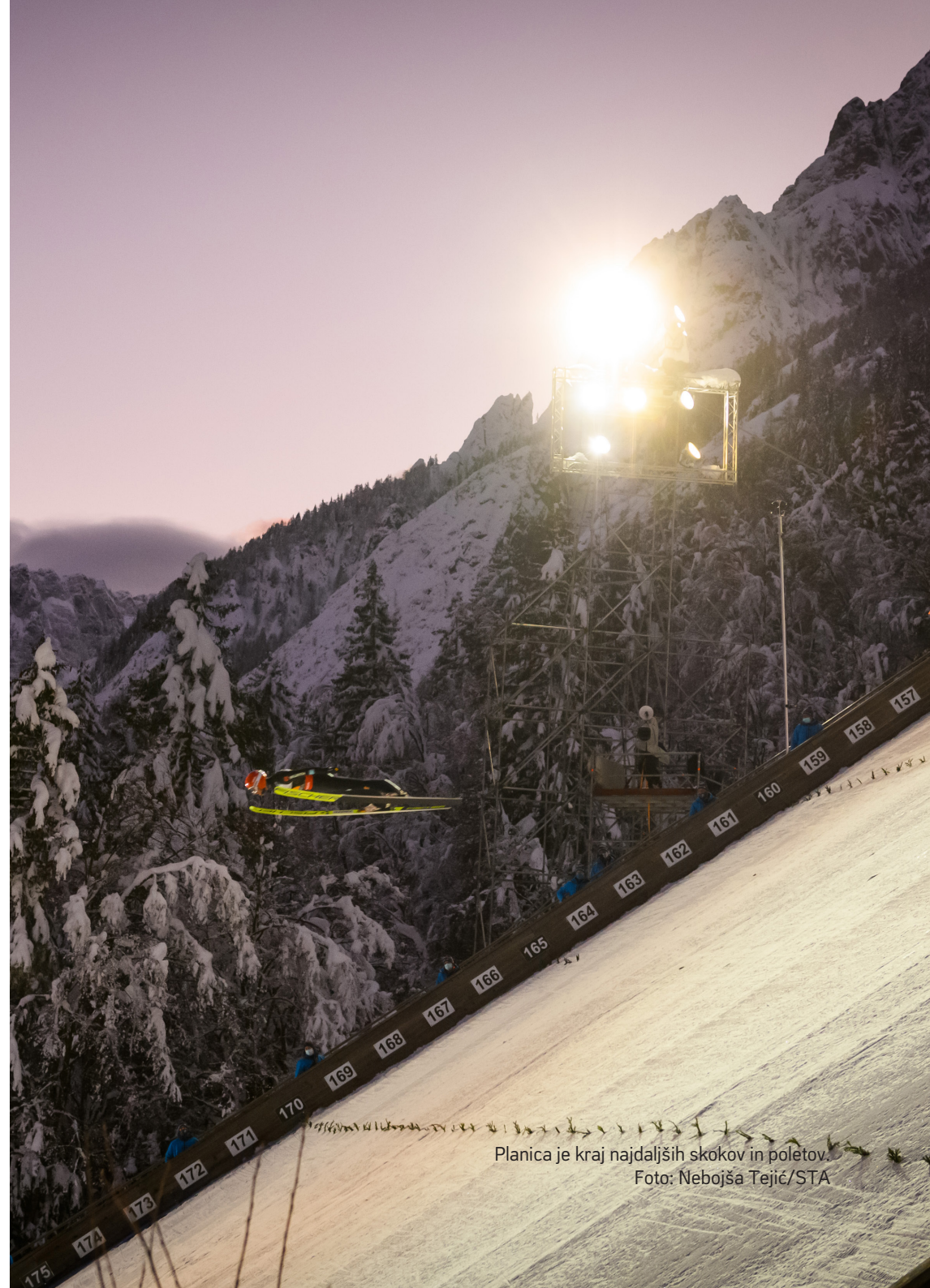
Planica je kraj najdaljših skokov in poletov.

Nordijski center Planica je idealen kraj za priprave, regeneracijo in druge dejavnosti v naravi tako za profesionalne kot ljubiteljske športnike. Poleg sedmih novih skakalnic in kraljice med njimi, letalnice, je pozimi urejenih več kilometrov tekaških prog za ljubitelje teka na smučeh.