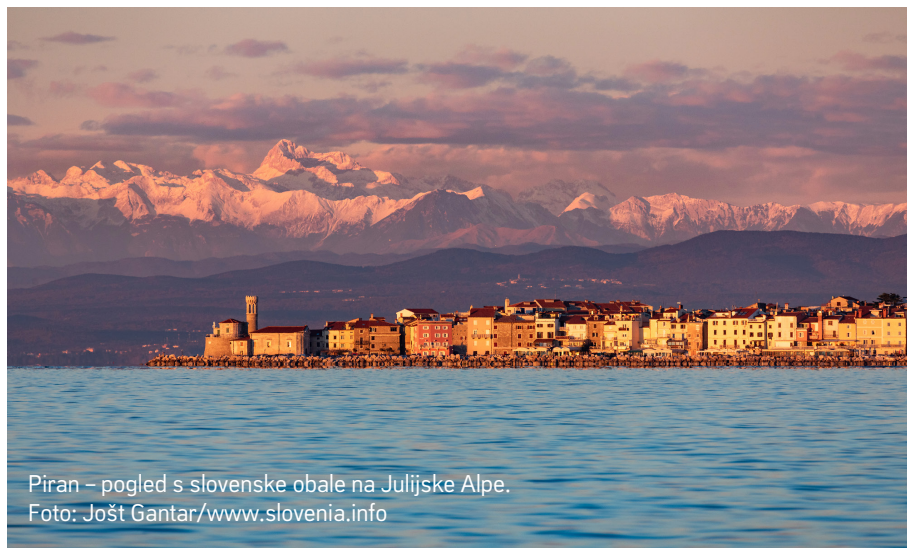
Piran – pogled s slovenske obale na Julijske Alpe.

Raznolikost slovenske narave pa je prispevala tudi k razvoju različnih ekosistemov in pestri biotski raznovrstnosti. Na našem ozemlju prebiva več kot 15.000 različnih živalskih vrst, od katerih je 850 endemičnih – takšnih, ki pretežno živijo le na območju Slovenije.