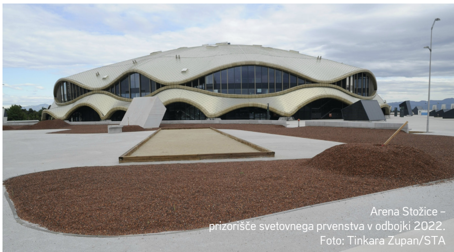
Arena Stožice – prizorišče svetovnega prvenstva v odbojki 2022.

stezami po vsej Sloveniji in telovadnico ob vsaki šoli, kjer se poleg šolskih izvajajo tudi rekreativne dejavnosti. Po državi so številna nogometna in košarkarska igrišča, nekaj sta jih postavila tudi brata Goran in Zoran Dragić – gre za prva pametna košarkarska igrišča v Sloveniji.