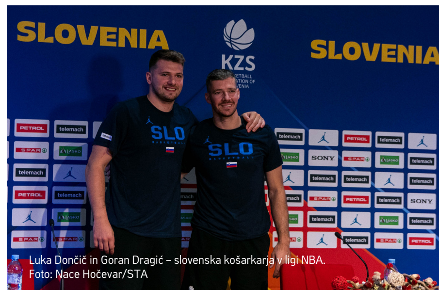
Luka Dončić in Goran Dragić – slovenska košarkarja v ligi NBA.

Nekdanja alpska smučarka Tina Maze je postavila mejnike v številu doseženih točk v eni sezoni – dosegla jih je kar 2414 v sezoni 2012/13, v kateri je kar enajstkrat stopila na najvišjo stopničko. Tina Maze je ena izmed šestih smučark, ki so zmagale v vseh petih disciplinah in ena od zgolj treh, ki jim je to uspelo v eni sami sezoni. V svoji karieri je zbrala 26 zmag in bila olimpijska prvakinja v smuku in veleslalomu.