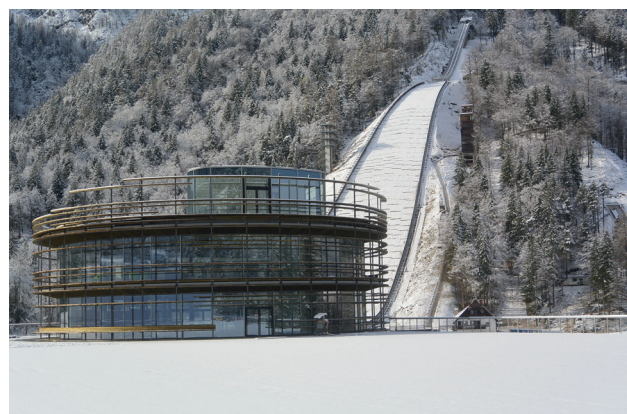
Nordijski center Planica – prizorišče svetovnega prvenstva v nordijskih disciplinah.