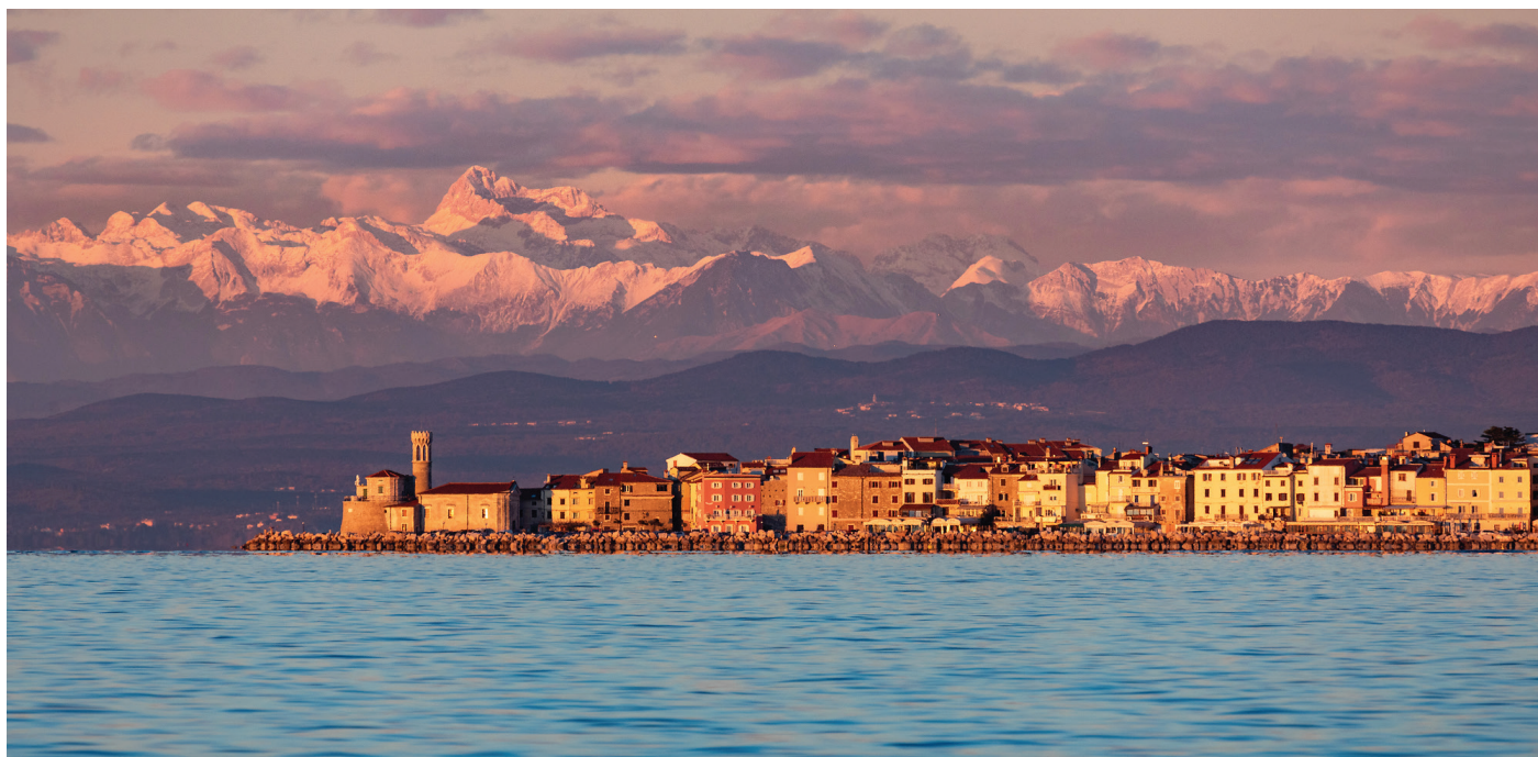
Piran – pogled s slovenske obale na Julijske Alpe.

Raznolikost slovenske narave pa je prispevala tudi k razvoju različnih ekosistemov in pestri biotski raznovrstnosti. Na našem ozemlju prebiva več kakor 15.000 različnih živalskih vrst, od katerih jih je 850 endemičnih, tj. takšnih, ki pretežno živijo le na območju Slovenije.