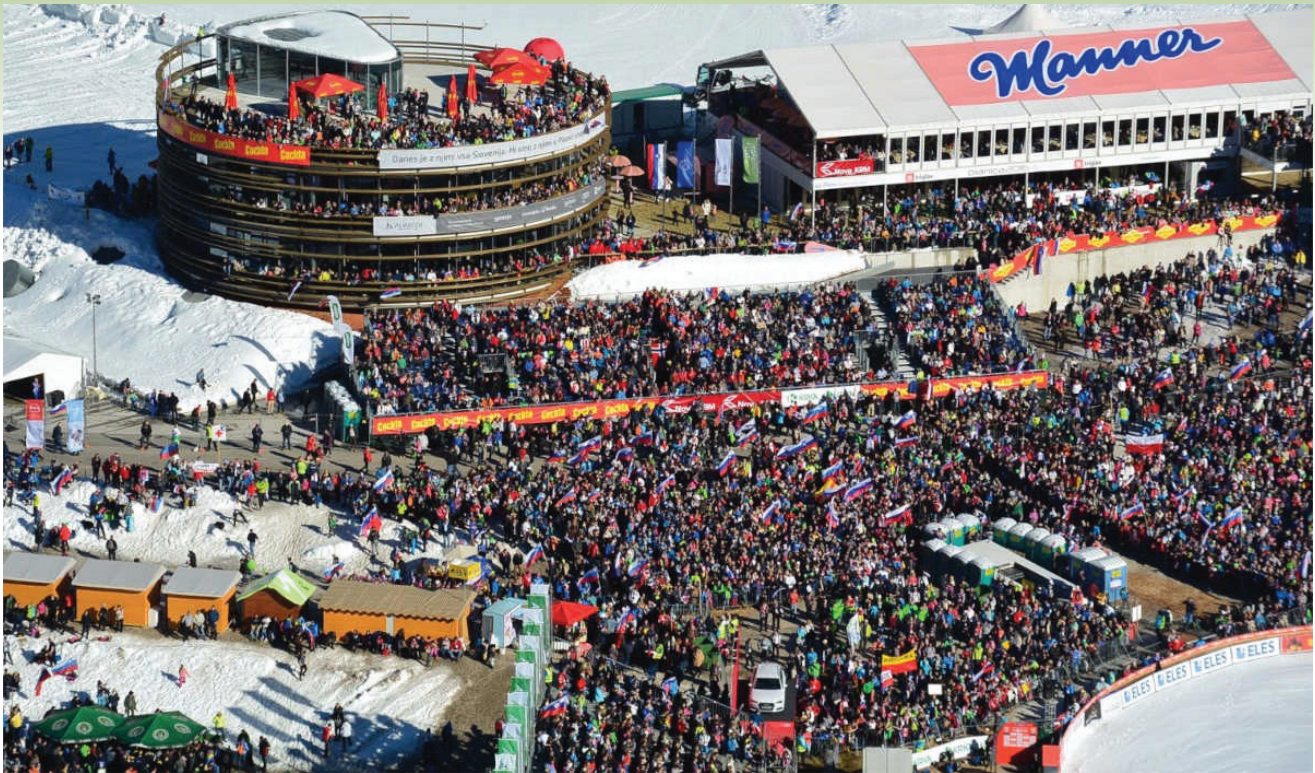
Planica vsako leto privabi številne obiskovalce.