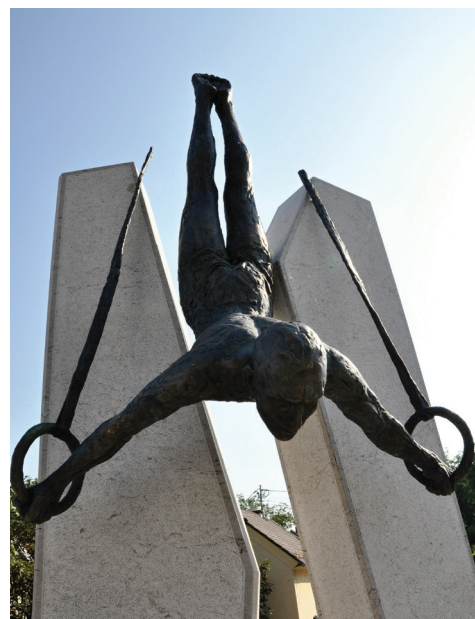
Leon Štukelj, olimpijski zmagovalec in legenda slovenskega športa