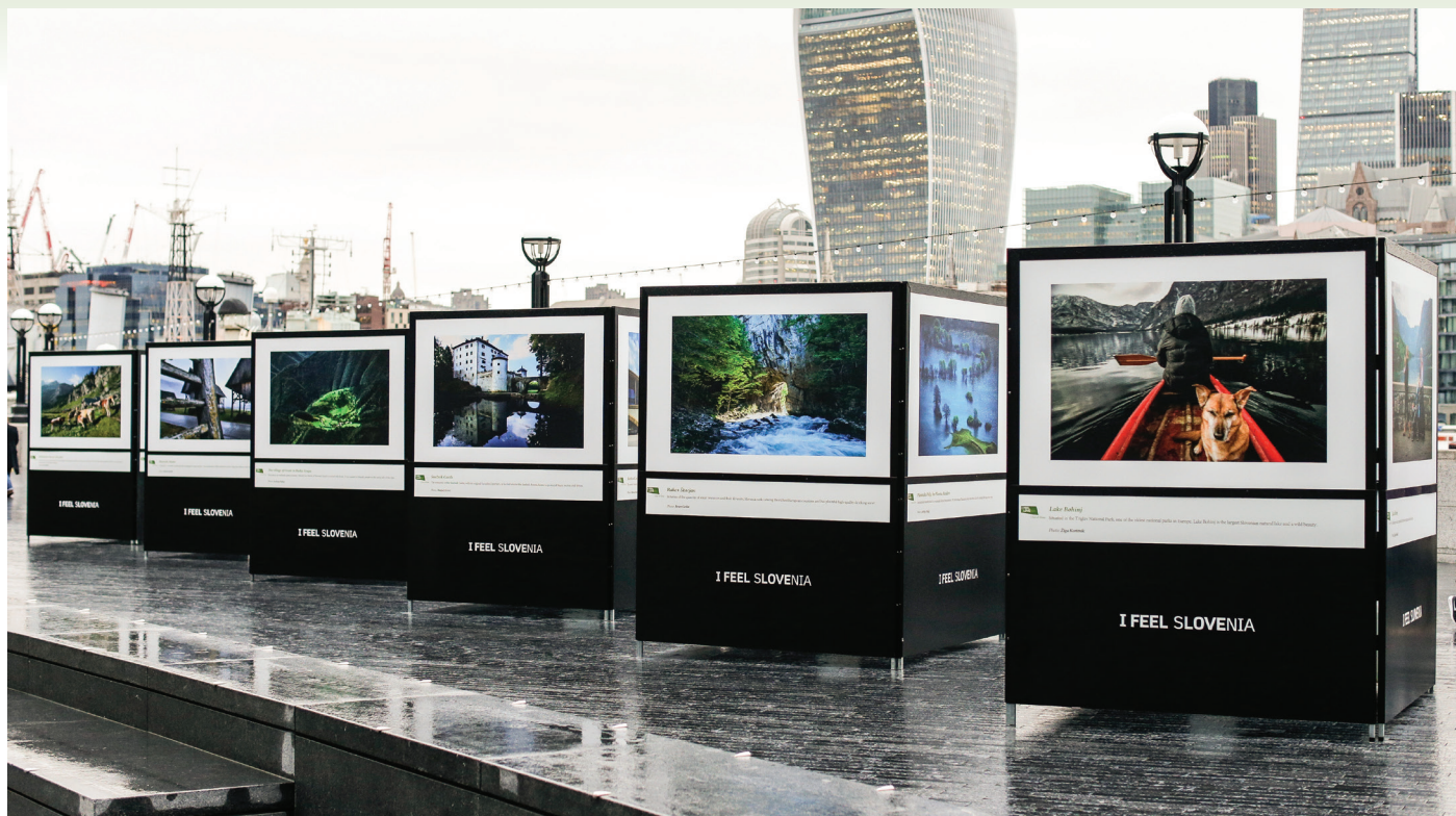
Razstava I feel Slovenia v Londonu.

Slovenija se v svetu predstavlja z nacionalno znamko I FEEL SLOVENIA. Njena vizualna podoba temelji na zeleni barvi, ki simbolizira slovenske gozdove, saj ti pokrivajo več kakor polovico države in nas na seznamu najbolj gozdnatih evropskih držav uvrščajo na zavidljivo tretje mesto.