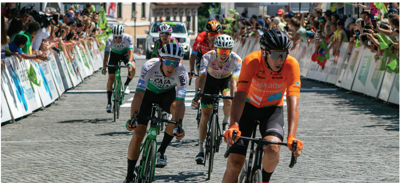
Dirka Po Sloveniji je priljubljena športna prireditev v Sloveniji.