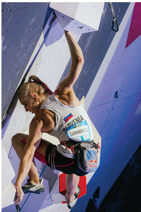
Janja Garnbret