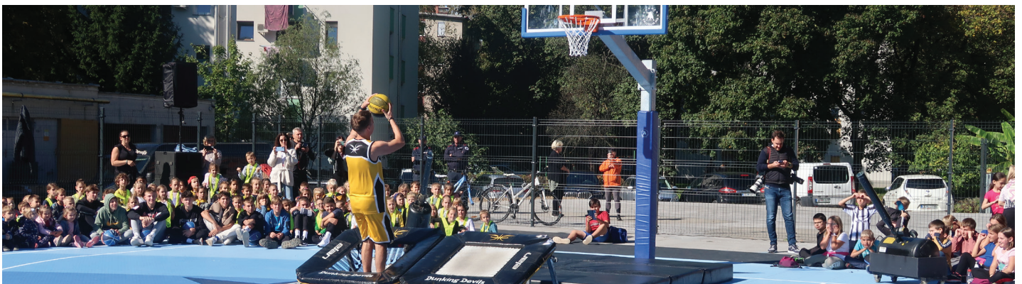
Košarkarsko igrišče v Celju - podpora Dallas Mavericks

Slovenci smo na drugem mestu na svetu po osvojenih olimpijskih medaljah na prebivalca , slovenski športniki pa so dobitniki številnih odličij na svetovnih prvenstvih. Vrhunski športni dosežki, izjemne naravne danosti, visoko razvita infrastruktura ter programi gibanja v vrtcih in športna vzgoja v osnovnih in srednjih šolah so le nekateri od dejavnikov, ki prispevajo k naši vseživljenjski povezanosti s športom in nas spodbujajo, da velik del svojega prostega časa namenjamo športnim in rekreativnim dejavnostim.