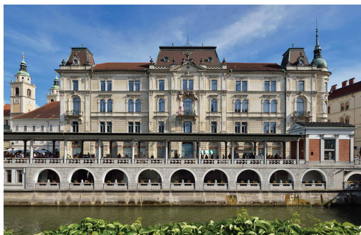
Pogled na Plečnikovo tržnico ob Ljubljani.