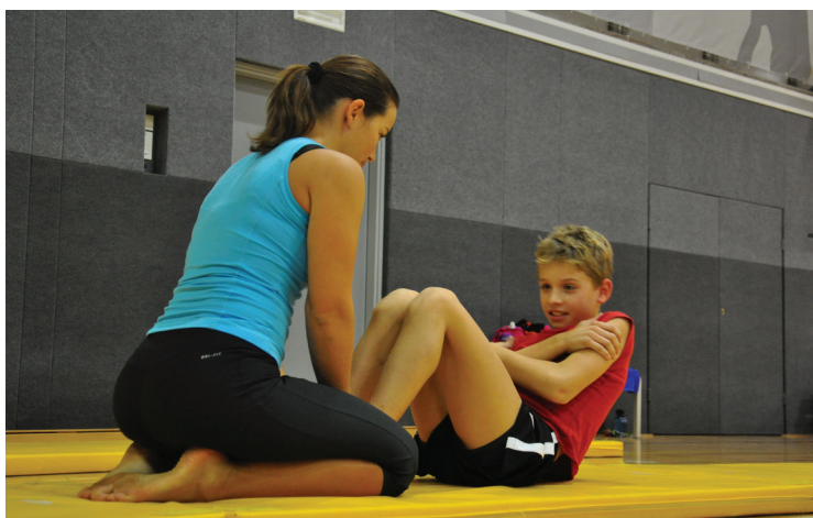
Testiranje SLOfit v osnovni šoli

V okviru projekta SLOfit je bilo v 30 letih testiranih več kakor milijon Slovenk in Slovencev oziroma polovica prebivalstva Slovenije