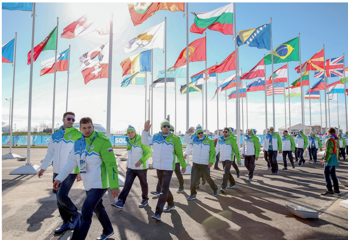
Slovenska olimpijska reprezentanca v barvah Olimpijskega komiteja Slovenije.

OKS zagotavlja tudi za vizualno poenotenje športnih društev, za kar smo v Sloveniji izbrali kombinacijo zelene, modre in bele barve. OKS športnim organizacijam svetuje, naj pri oblikovanju nacionalne športne opreme upoštevajo naslednje razmerje barv: 50 odstotkov zelene 30 odstotkov modre 20 odstotkov bele.