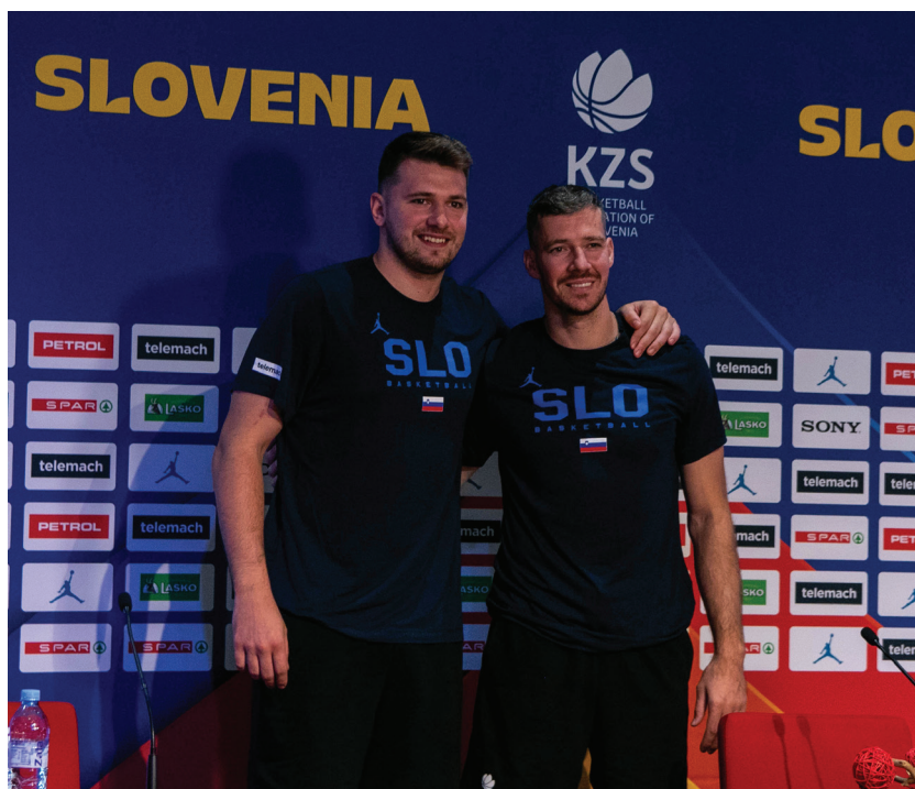
Luka Dončić in Goran Dragić – slovenska košarkarja v ligi NBA.

Nekdanja alpska smučarka Tina Maze je postavila mejnike v številu doseženih točk v eni sezoni – dosegla jih je kar 2414 v sezoni 2012/13, v kateri je kar enajstkrat stopila na najvišjo stopničko. Tina Maze je ena izmed šestih smučark, ki so zmagale v vseh petih disciplinah in ena od samo treh, ki jim je to uspelo v eni sezoni. V svoji karieri je dosegla 26 zmag ter bila olimpijska prvakinja v smuku in veleslalomu.