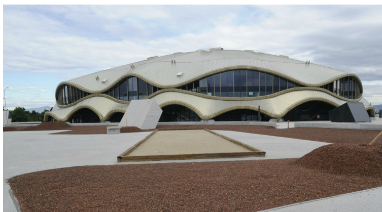
Arena Stožice – prizorišče svetovnega prvenstva v odbojki 2022.

Rekreativci so navdušeni nad skoraj 10.000 kilometri planinskih poti in 1200 kilometrov dolgo slovensko planinsko transverzalo, slikovitimi kolesarskimi stezami po vsej Sloveniji in telovadnico ob vsaki šoli, kjer se poleg šolskih izvajajo tudi rekreativne dejavnosti. Po državi so številna nogometna in košarkarska igrišča, nekaj sta jih postavila tudi brata Goran in Zoran Dragić – gre za prva pametna košarkarska igrišča v Sloveniji.