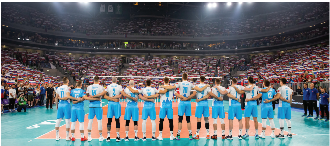
SP v odbojki za moške v ljubljanskih Stožicah.